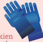
ebakien aurkako eskularruak