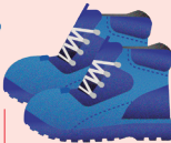
calzado de seguridade