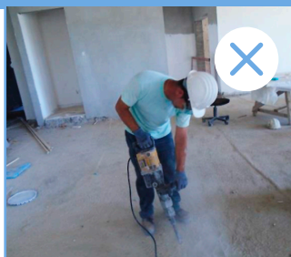
Uso de martillo sin sistema de captación de polvo ni protección respiratoria

Esta ficha trata las operaciones de demolición llevadas a cabo sobre superficies o estructuras de hormigón, mampostería o piedra mediante martillos neumáticos o martillos eléctricos. Principalmente, se trata de demoliciones en zonas concretas (volumen reducido de demolición) o que tienen lugar en espacios restringidos/interiores. Esta actividad supone riesgo de exposición a Sílice Cristalina Respirable (SCR) ya que habitualmente genera grandes cantidades de polvo muy fino a partir de los materiales anteriormente mencionados, los cuales cuentan con un alto contenido de Sílice Cristalina (SC) (en el caso de la piedra variará en función de su naturaleza).