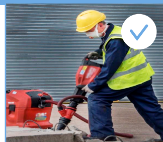
Uso de martillo con sistema de captación de polvo y protección respiratoria