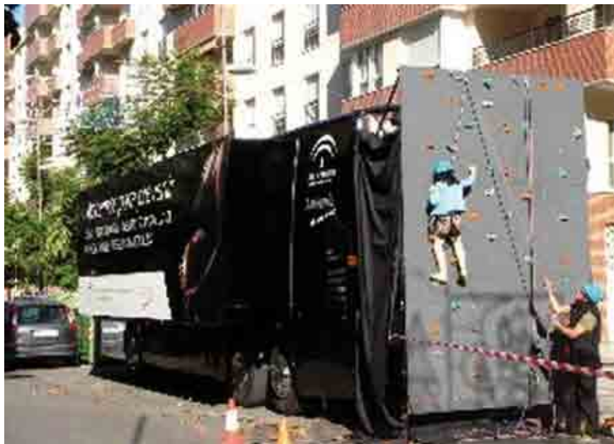
“Autobús de la prevención”