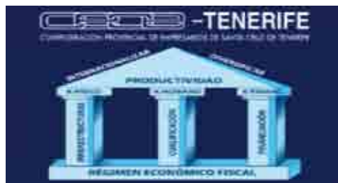
Spot campaña de Prevención de Riesgos Laborales CEOE-TENERIFE